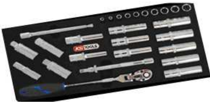
27 douilles longues + accessoires ¼ ½ 3/8