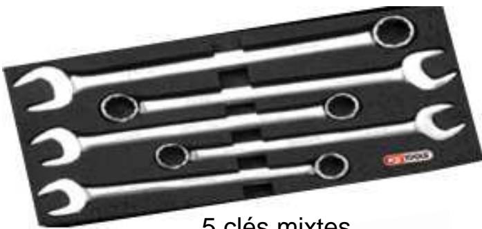
5 clés mixtes