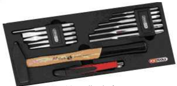
12 outils de frappe et cutter