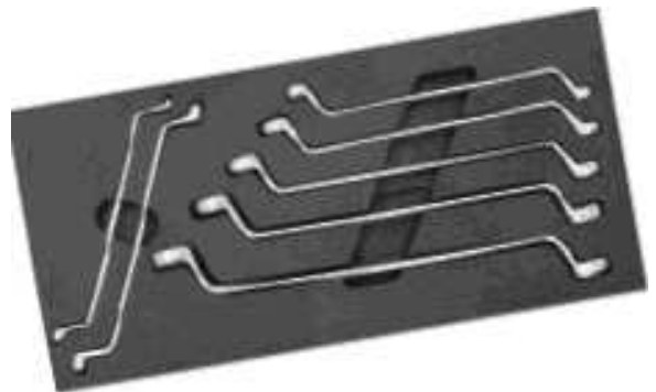
7 clés polygonales contre coudées