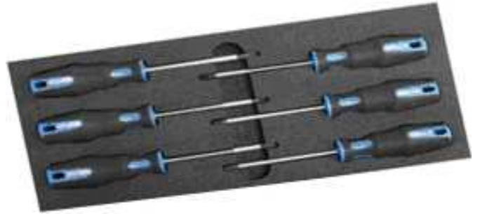
6 tournevis Torx