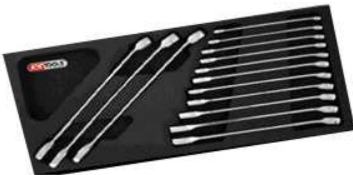
14 clés mixtes