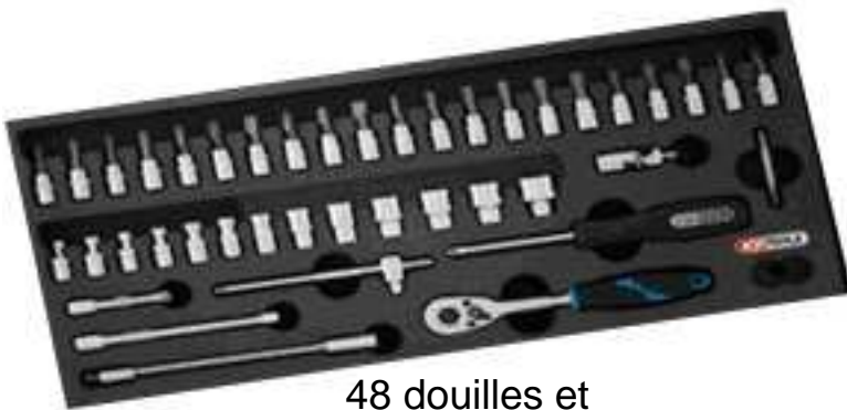
48 douilles et accessoires 1/4