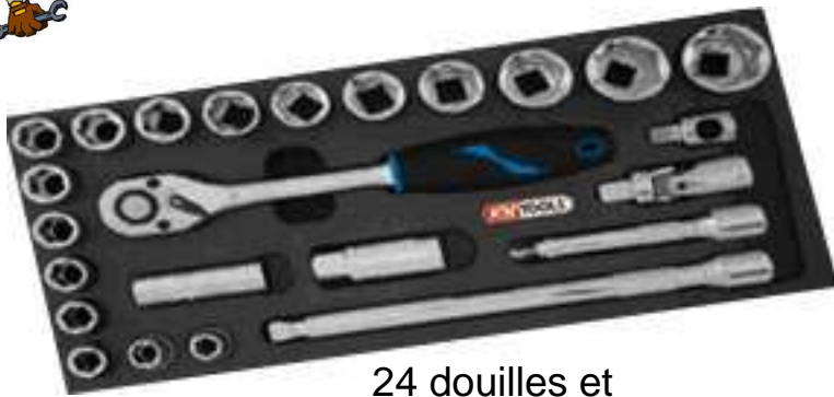
24 douilles et accessoires 1/2