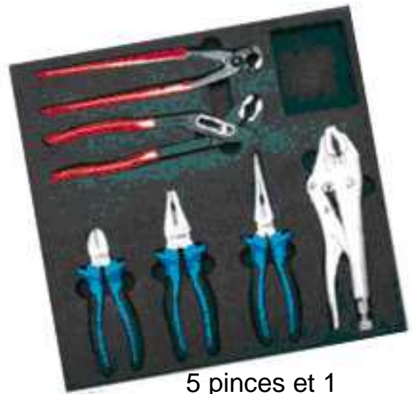
5 pinces et 1 tenaille