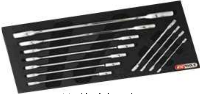
11 clés à fourche