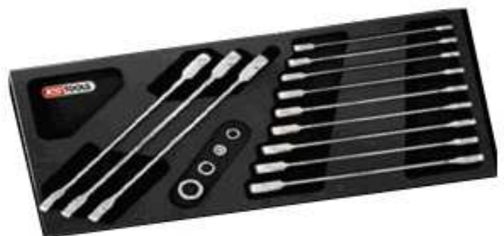
16 clés mixtes à cliquet Gearplus